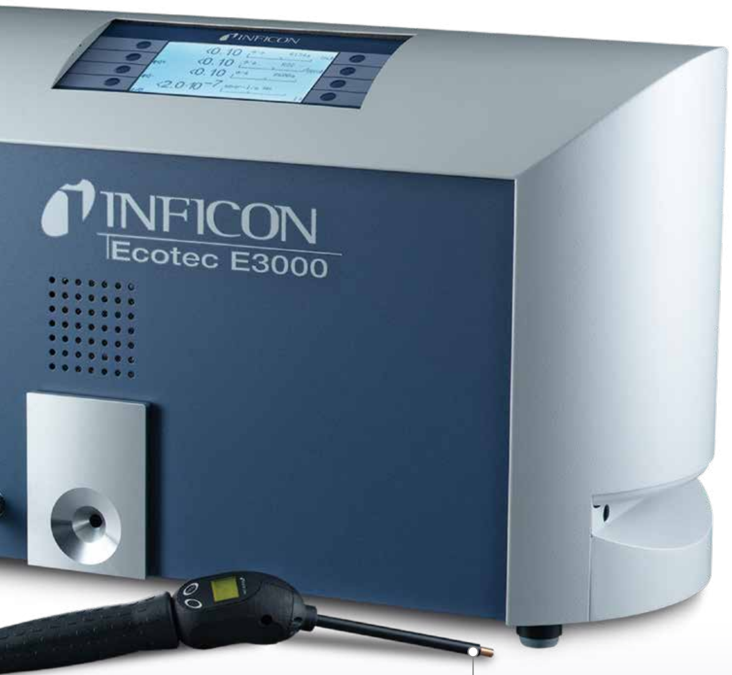
기본 탑재 조명