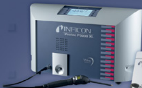
Protec P3000XL ヘリウムリークディテクタ