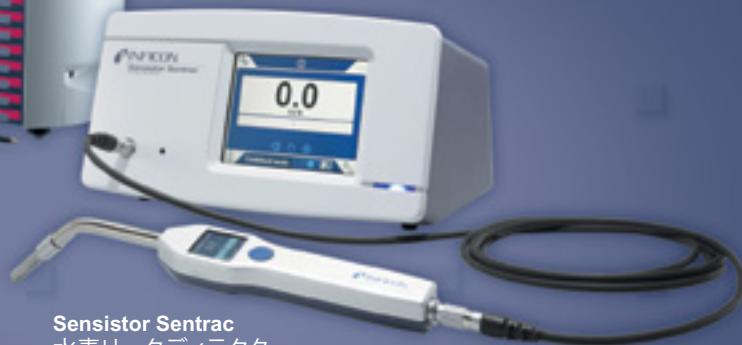
Sensistor Sentrac 水素リークディテクタ ※5%濃度水素使用