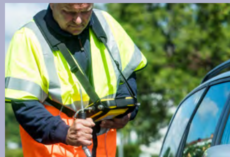
Progettato per ottimizzare l'ergonomia e la corretta distribuzione del peso.

La combinazione del sensore e del gascromatografo (GC), appositamente sviluppati, permette un'immediata distinzione tra gas di fermentazione e gas naturale. Ciò consente all'operatore di determinare rapidamente se il gas rilevato provenga da una condotta, da gas di fermentazione o da gas naturale di altra