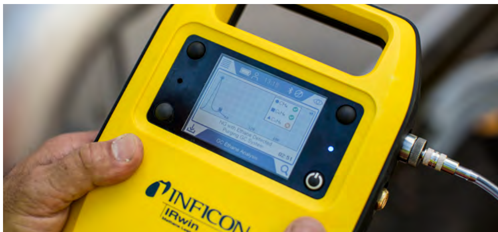
Analisi del gas effettuata in maniera rapida sul posto.

IRwin è leggero (1,6 kg) e facile da trasportare. Lo strumento e i suoi accessori sono pensati per l'utilizzo mobile nelle condizioni più ostili. Il sistema a sonda modulare limita, nello specifico, il numero di accessori di cui il personale necessita durante l'ispezione della rete. Grazie ai pratici raccordi rapidi, l'operatore può sempre applicare la sonda più adatta alla situazione specifica.