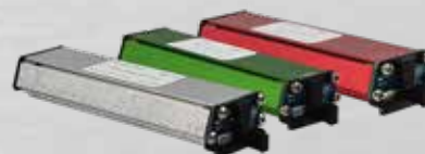
De izquierda a derecha: sensor de refrigerante 724-701-G1, sensor de CO 2 724-701-G2 y sensor de refrigerantes inflamables 724-701-G3.