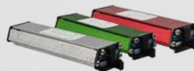
De izquierda a derecha: sensor de refrigerante 724-701-G1, sensor de CO 2 724-701-G2 y sensor de refrigerantes inflamables 724-701-G3.