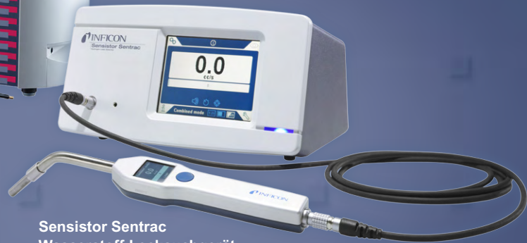
Sensistor Sentrac Wasserstoff-Lecksuchgerät

SCHNELLER ■ SICHERER ■ KOSTENEFFIZIENTER