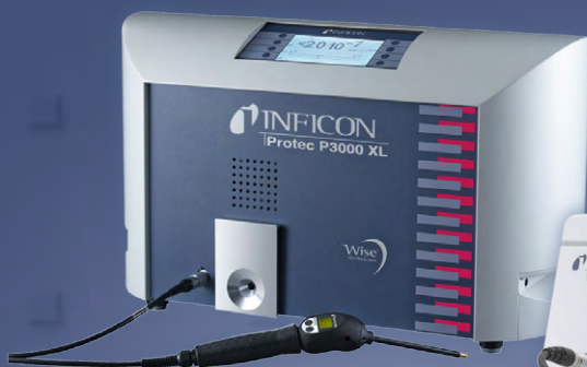
Protec P3000XL Helium-Lecksuchgerät