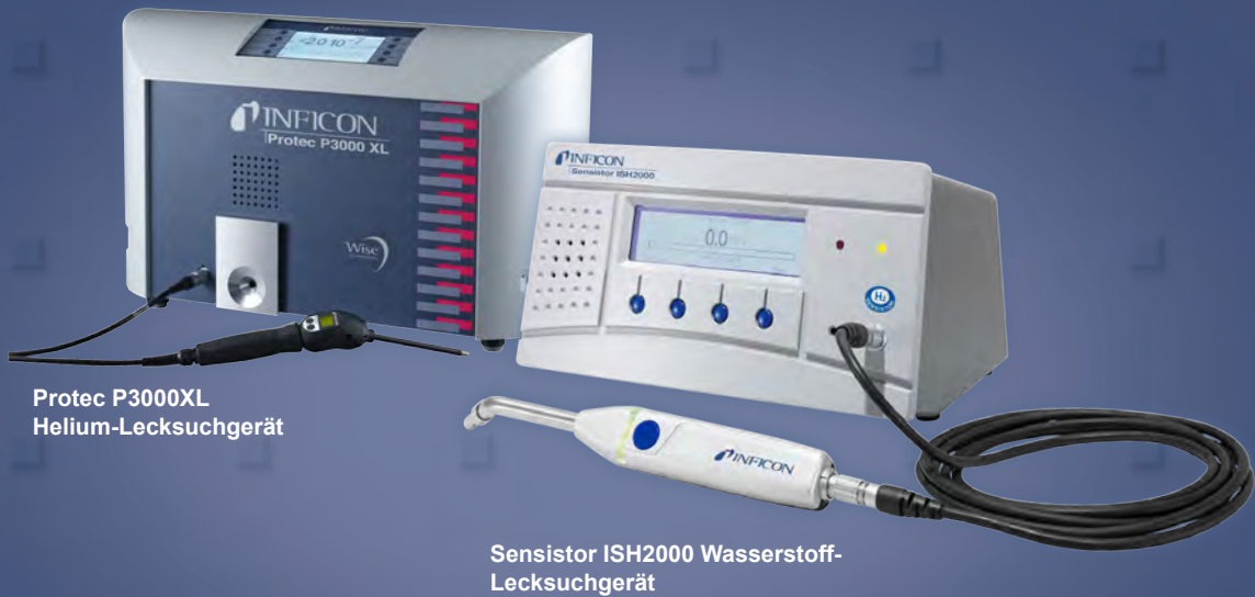
Protec P3000XL Helium-Lecksuchgerät