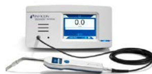
Sensistor Sentrac 氢气泄漏检测器