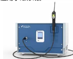
XL3000flex 氦气和氢气泄漏检测器

INFICON公司的高性能嗅探式泄漏检测器专为高精度工业泄漏测试而设计, 包括XL3000flex氦气和氢气泄漏检测器 (用于在苛刻的生产环境中全天候嗅探), 以及经济型Sentrac氢气泄漏检测器, 后者具有处理小泄漏和大泄漏的独特能力, 既可应用于生产线, 也可应用于维修线。