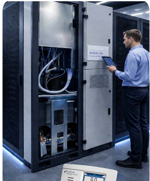
数据中心机架内的CDU原型。 Sentrac 为组件级和组装系统的验证提供经济型泄漏测试解决方案,确保CDU安装后冷却液回路保持完全密闭。AI生成的图片