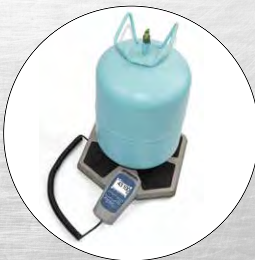
Dargestellt mit Kleinlast-Adapter-Kit zur Befestigung von A3-Kältemittelflaschen (SEPARAT ERHÄLTICH)