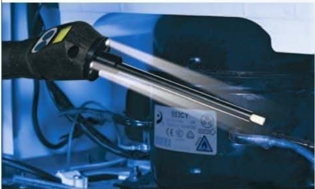
内置照明便于检漏