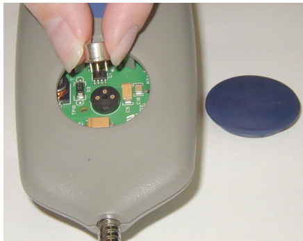
Figura 2. Instalación del sensor