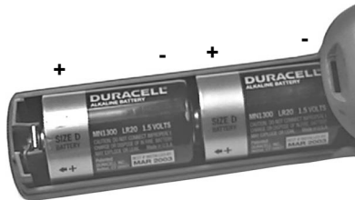
Figura 1. Pilas alcalinas debidamente instaladas

Cuando se agoten las pilas, el indicador verde de baja carga de las pilas comenzará a parpadear. Aunque es posible seguir utilizando el TEK-Mate hasta una hora después de que se encienda el indicador de baja carga de las pilas, éstas se deben reemplazar lo antes posible.